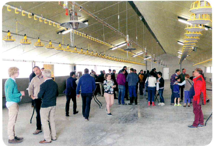
Cliché lors de la porte ouverte. On distingue les lignes d'assiettes ovales, de pipettes avec coupelles de récupération et les radiants à gaz.

Les trappes pour l'accès au parcours sont extérieures, ce qui représente un avantage, dans la mesure où elles ne constituent pas un éventuel obstacle lors du nettoyage de l'intérieur. Enfin, les piquets de clôture sont d'acacia.